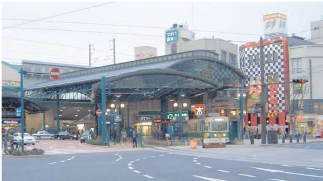
▲改良後のJR横川駅前、タクシーのりばの後ろがJR改札口 駅舎自体もオシャレになり賑わいも出てきた

◇みなさんは今の岡山駅前にある路面電車の乗り場が便利だと思いますか？不便と思われますか？私たちRACDAはJRから路面電車への乗り換えが楽に出来る様、路面電車の駅前広場乗り入れを提案しています。 ◇他の都市でも同じ様な動きがあり、広島市の横川駅と高知市の高知駅で実現しています。