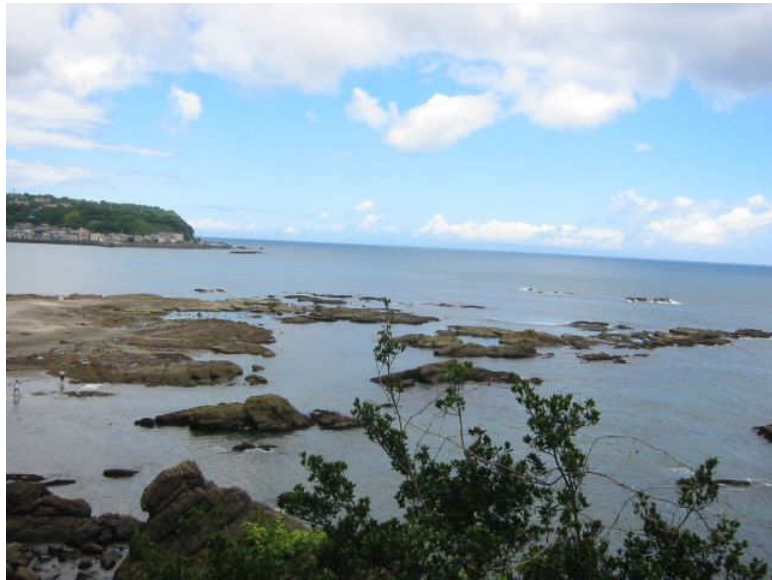
↑ 今井浜の風景です。。 (河津まで散歩の途中、16日午後撮影)