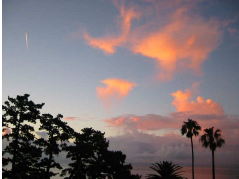
↑ 梅雨明け?の空。。 (ホテルのベランダにて、16日早朝撮影)