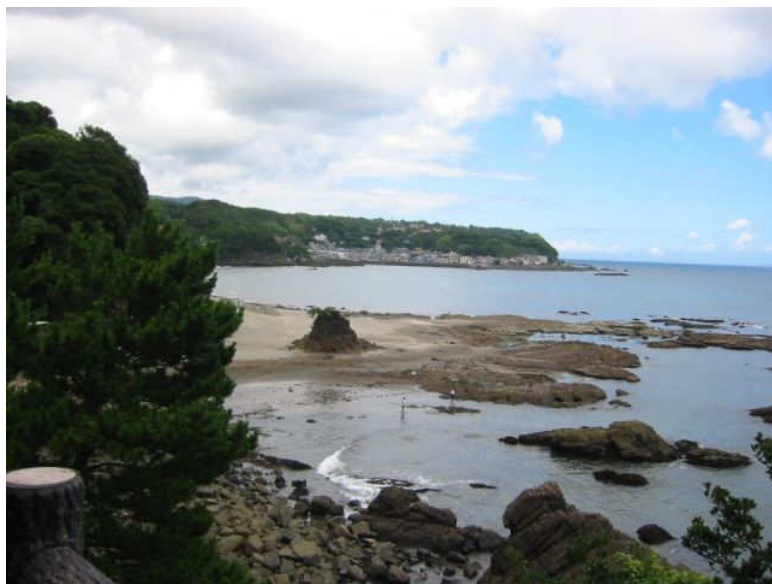
↑ 今井浜の風景 (河津まで散歩の途中、16日午後撮影)