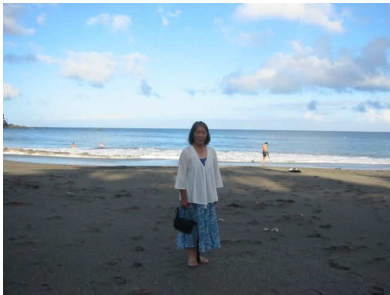
↑ ホテル前の浜辺にて(到着日の夕方)

「爺&婆」は、一足早い夏休み？旅行をしました。。 (2010年7月15～17日、今井浜、2泊3日旅行)