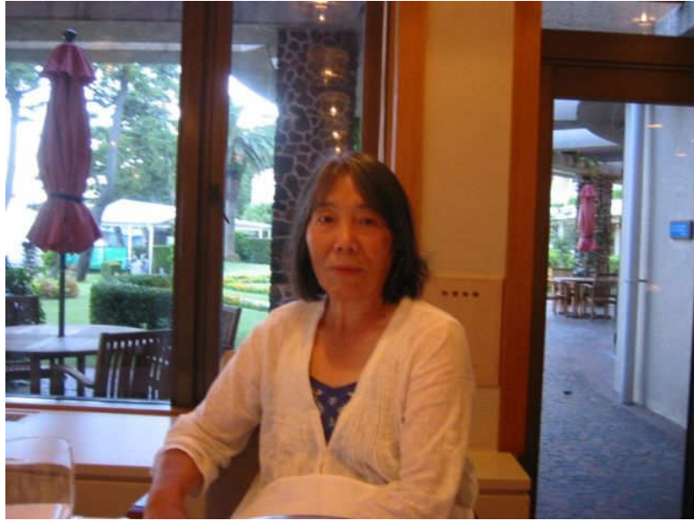
↑ ホテルの食堂にて (食事前のご機嫌なひととき)