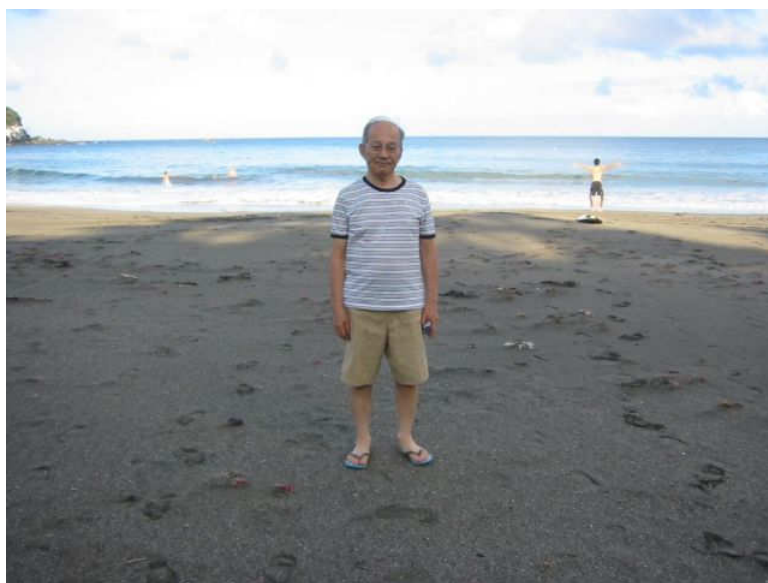
↑ ホテル前の浜辺にて(同上)