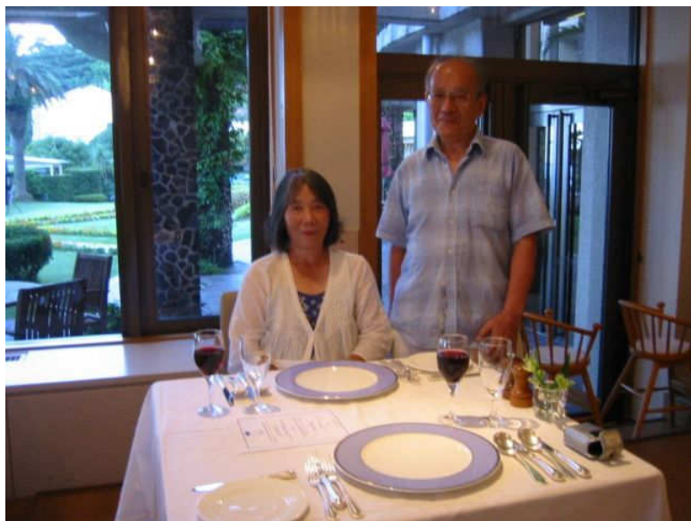
↑ ホテルの食堂にて。。