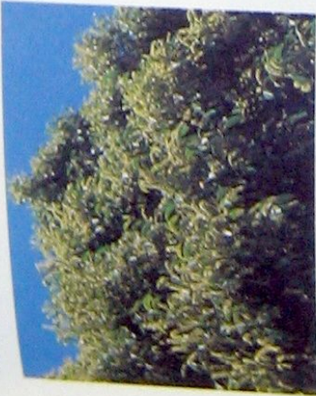
花でまっ黄色に見えるスタジイの大木。

おぼなは8～12cm、新しい 枝のつけねに上向きにつく。 めばなは、下のほうの葉のつけねに 短い穂をつける。