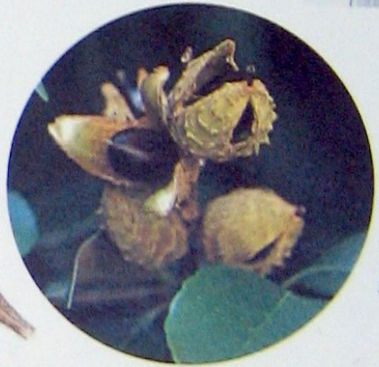
顔を出したシイの実