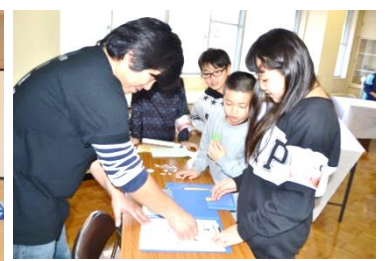
クリアするとスタンプがもらえる!