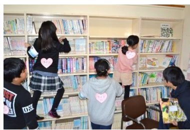
動物はどこに隠れているかな?