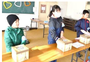
箱の中には何が入っているかな?