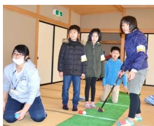
ホールインワンを目指せ!