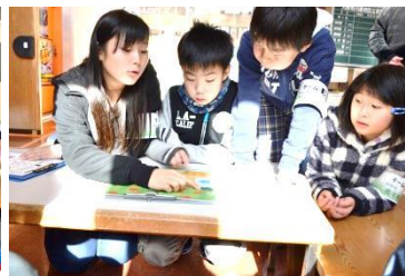
間違い探し! 「ここじゃない?」 何の漢字になるんだろう?